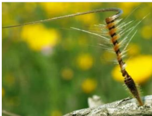
זרע מקור החסידה