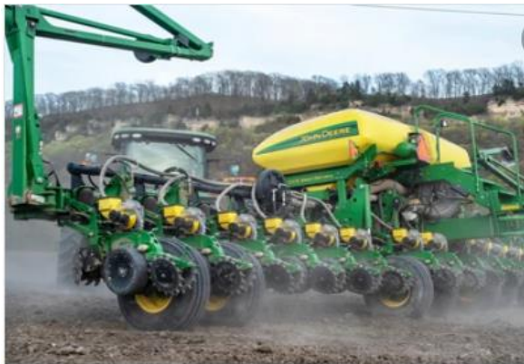
דריל - מכונת זריעה