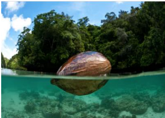
זרע דקל הקוקוס