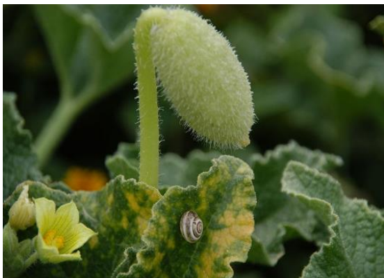
פרי ירוקת-חמור מצויה