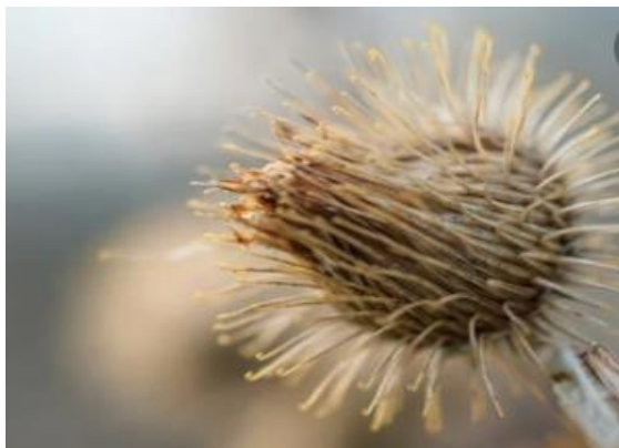
זרע צמח הלפה