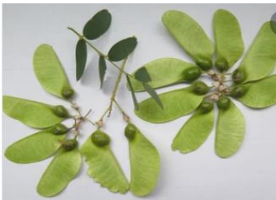
פירות מכנף נאה