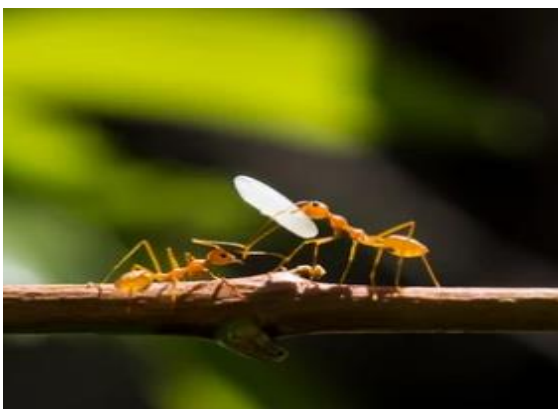
נמלת אש נושאת זרע אורז