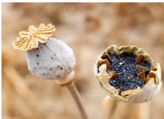
פרי זרעים של פרג אגסי