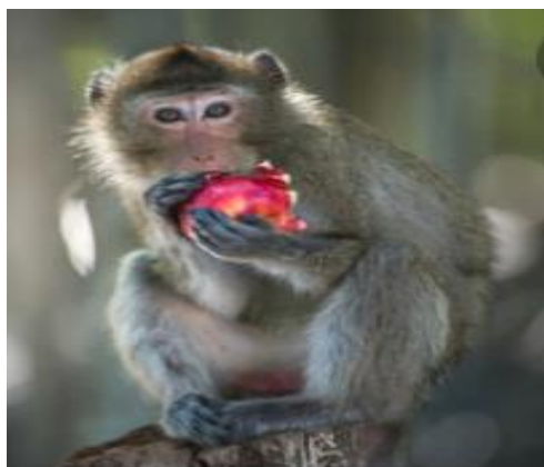
קוף מקוק אוכל תפוח